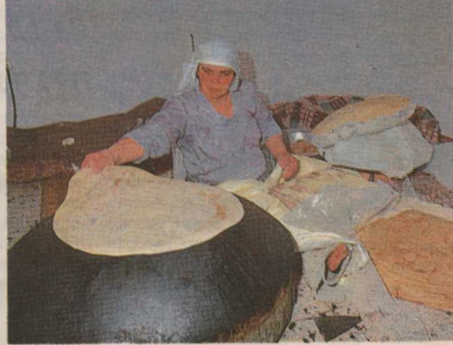
ביתן הפיתות הדרוזיות, הלבנה והזעיר