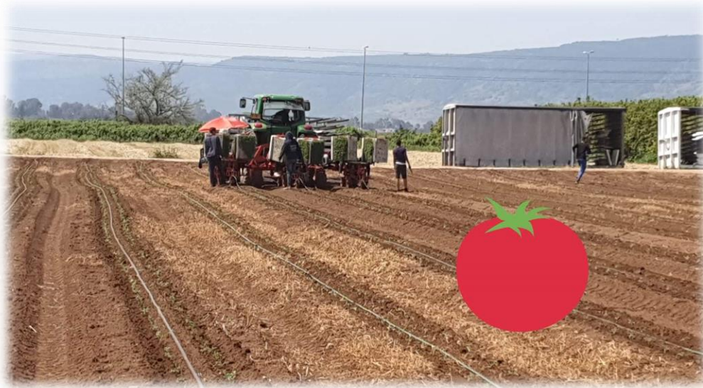
איור 1 שותלים עגבנית בחלקה ג'

ג. לול – הלול הוא יצרן מזון – ולכן ממשיך במלוא המרץ בעבודתו השוטפת