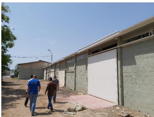
איור 3 מכון עלה "אהרי" יריב דאי מובל סוור קבלנים במכון עלה המשופץ

אמצע מאי] נשכיר את כל המבנה – חוליות ישכרו את רוב המבנה [יש לציין כי עד כה חלק מהמבנה לא הושכר – ועם סיום השיפוץ כולו יהיה ניתן להשכרה כמחסן באיכות גבוהה] – זו הזדמנות מצוינת לשבח את יריב דאי שמנהל את הפרויקט בצורה מצוינת תוך הפגנת אכפתיות רבה ומקצועיות טובה.