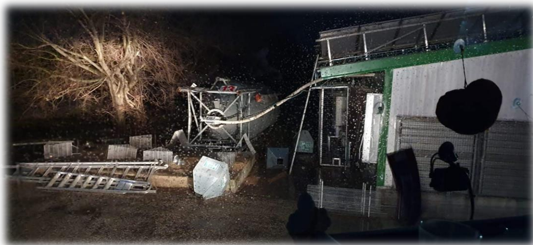
איור 2 מיכל תערוכת שנפל בלול - תמונה שצולמה תו"כ הסערה

ד. נזקי סופה – בסופה שהתחוללה באמצע מרץ ספג הלול נזקים לא קטנים, הופעל ביטוח הגיע שמאי בבוקר שלאחר הסופה ותוקנו התקלות החיוניות כאשר חלק מהעבודות יבוצעו עם סיום הלהקה הנוכחית