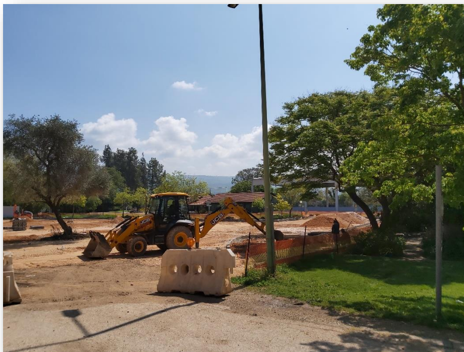
איור 5 עבודה על החנייה החדשה של הגנים מאחרו ניתן לראות את מגרש הכדורסל

d. פרויקט בטיחות גנים – פרויקט זה מבוצע ע"י המוא"ז מוביל שי זיו מנהל האג"מ ויריב דאי כנציג האגש"ח מסייע ומשגיח על הפרויקט, הפרויקט ממומן ע"י משרדי הממשלה וההשתתפות הקיבוץ היא קטנה - המקור לכך הוא השתתפות הדיירים החדשים שמפקידים כסף לטובת שיקום תשתיות במועצה וזאת בעת תחילת תהליך בניית ביתם.